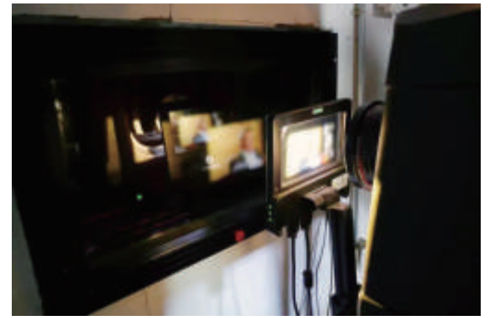
保障影院多线运营

在全生命周期的品质服务方案中,中影巴可还特别考虑到院线的运营痛点:多影院管理难度大、资源配置工作复杂、维护成本居高不下……对此中影巴可为院线提供了集中维保、NOC监管、移机、定制报告等服务,让院线能以更低成本,更高效高质量的完成多线运营。