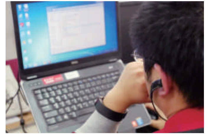
中影巴可7*24的专家值守服务

随着市场环境的改变,人力成本的上涨给影院运营造成的压力越来越大。如何进一步帮助影院控制运营成本?中影巴可全方位托管服务为影院运营打开了新思路。在中影巴可的托管服务中,影院将彻底释放原来高昂的人力成本,取而代之的是轻量化的智慧运营+中影巴可7*24的专家值守服务,为影院开启开源节流的的全新运营模式。